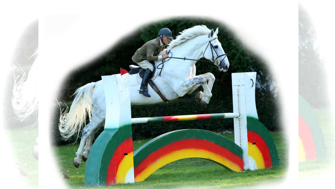
Concurso de saltos open no oficial

Real Sociedad Hípica de San Sebastián - Hípica de Loyola